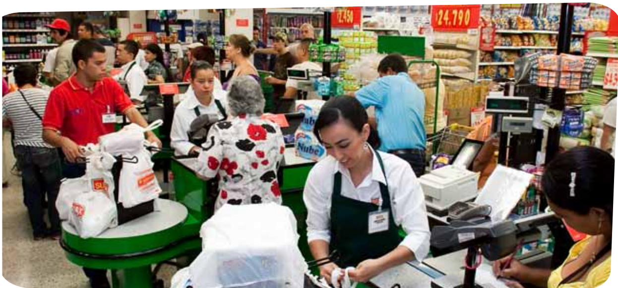
Dos almacenes se convirtieron a Bodegas Surtimax en Medellín