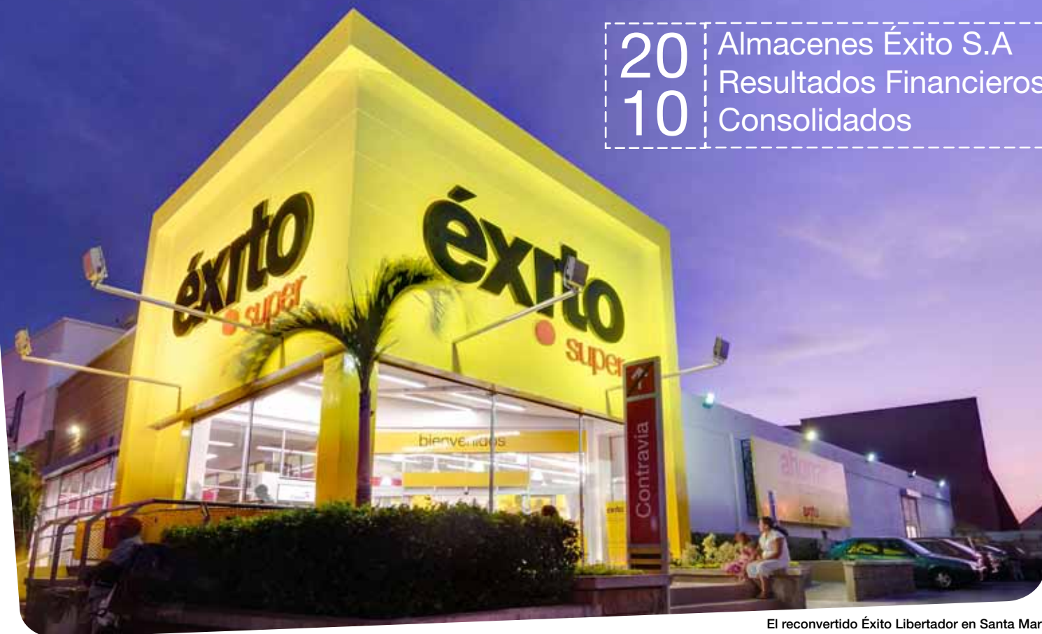
El reconvertido Éxito Libertador en Santa Marta

Almacenes Éxito S.A Resultados Financieros Consolidados