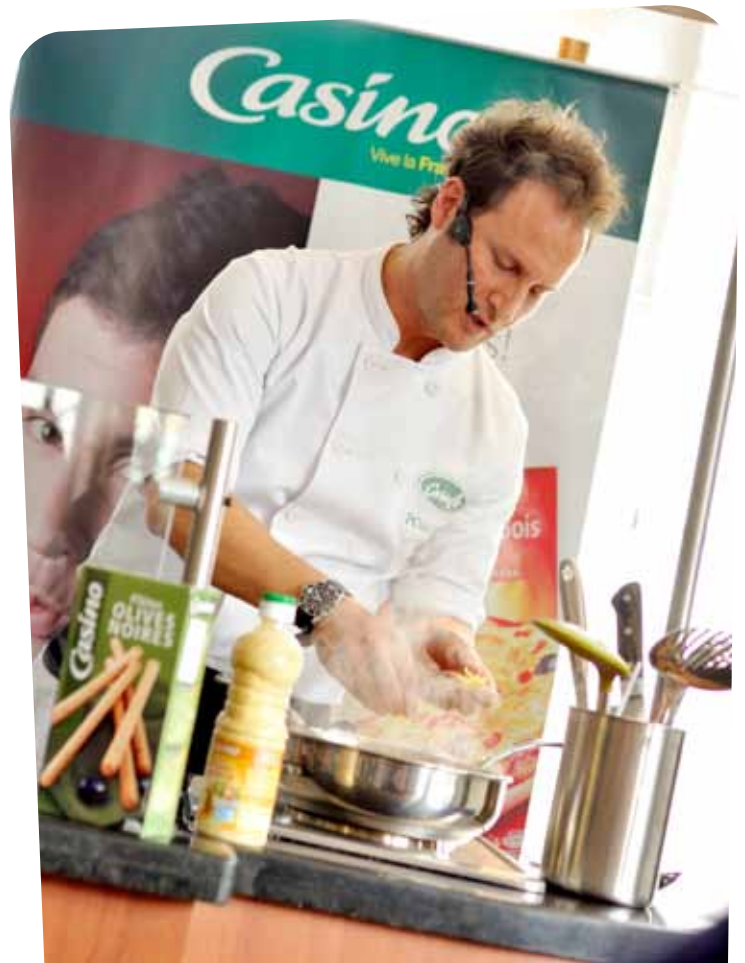
Chefs enseñan a nuestros clientes cómo usar los productos importados Casino

Paralelamente al Mundial de fútbol, la compañía vendió de manera exclusiva, en más de 250 almacenes del país,