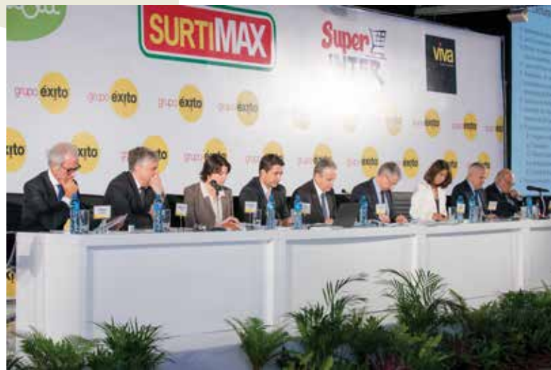
Reunión grupos de interés