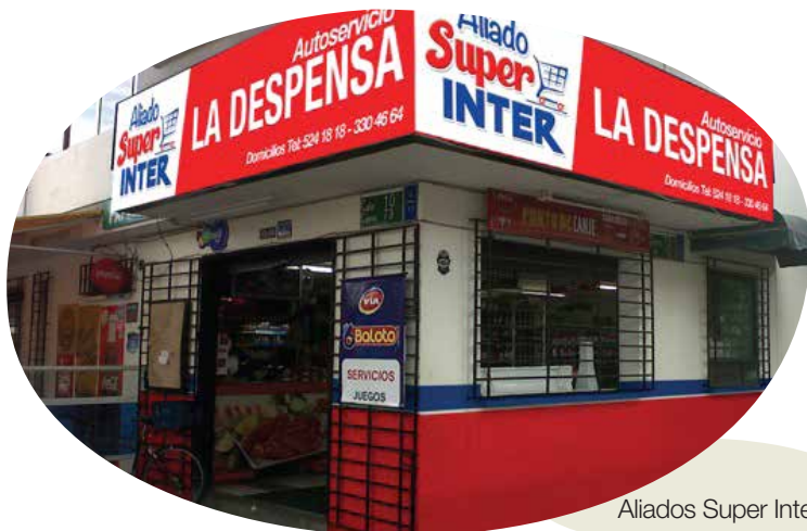
Aliados Super Inter