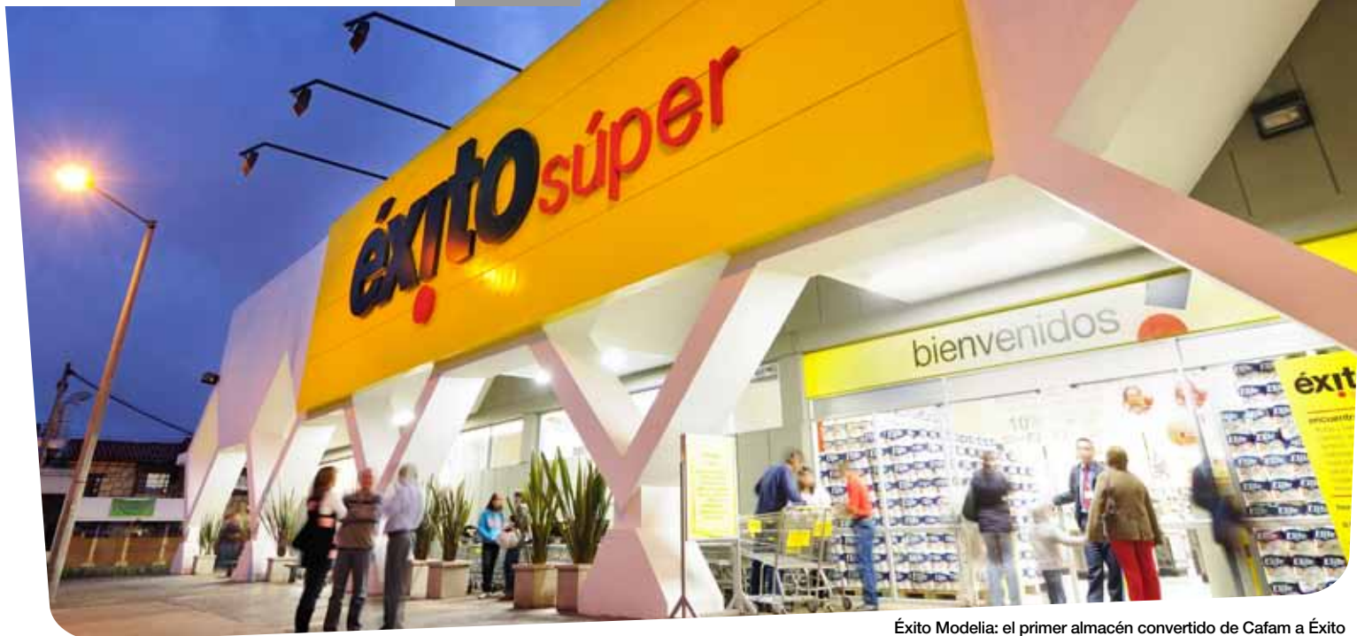
Éxito Modelía: el primer almacén convertido de Cafam a Éxito