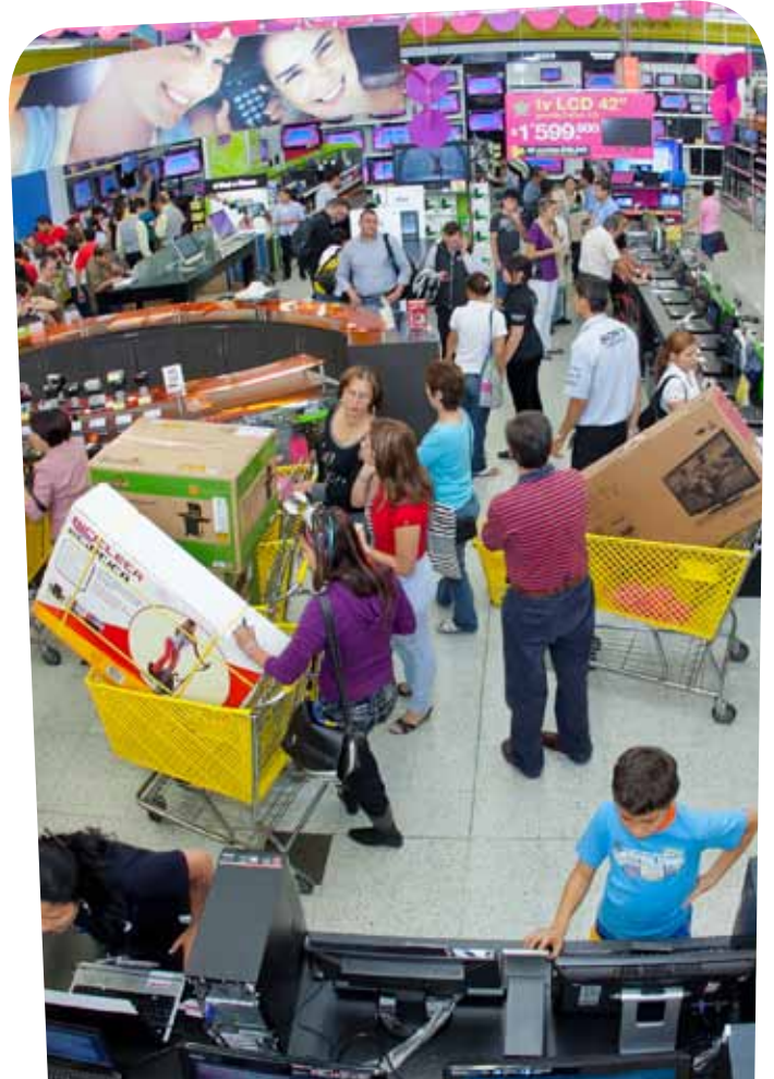
Los colombianos disfrutaron la promoción Días de Precios Especiales en el Éxito