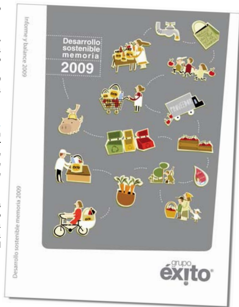
Responsabilidad social: presentamos la actualización de nuestra Memoria de desarrollo sostenible.

Utilidad neta. Aumentó a $22,071 millones para el primer trimestre de 2009 comparado con $2,050 millones obtenidos durante el mismo período del año anterior. Como porcentaje de los ingresos operacionales el margen neto aumentó a 1.3% en 2010, de 0.1% del primer trimestre de 2009.