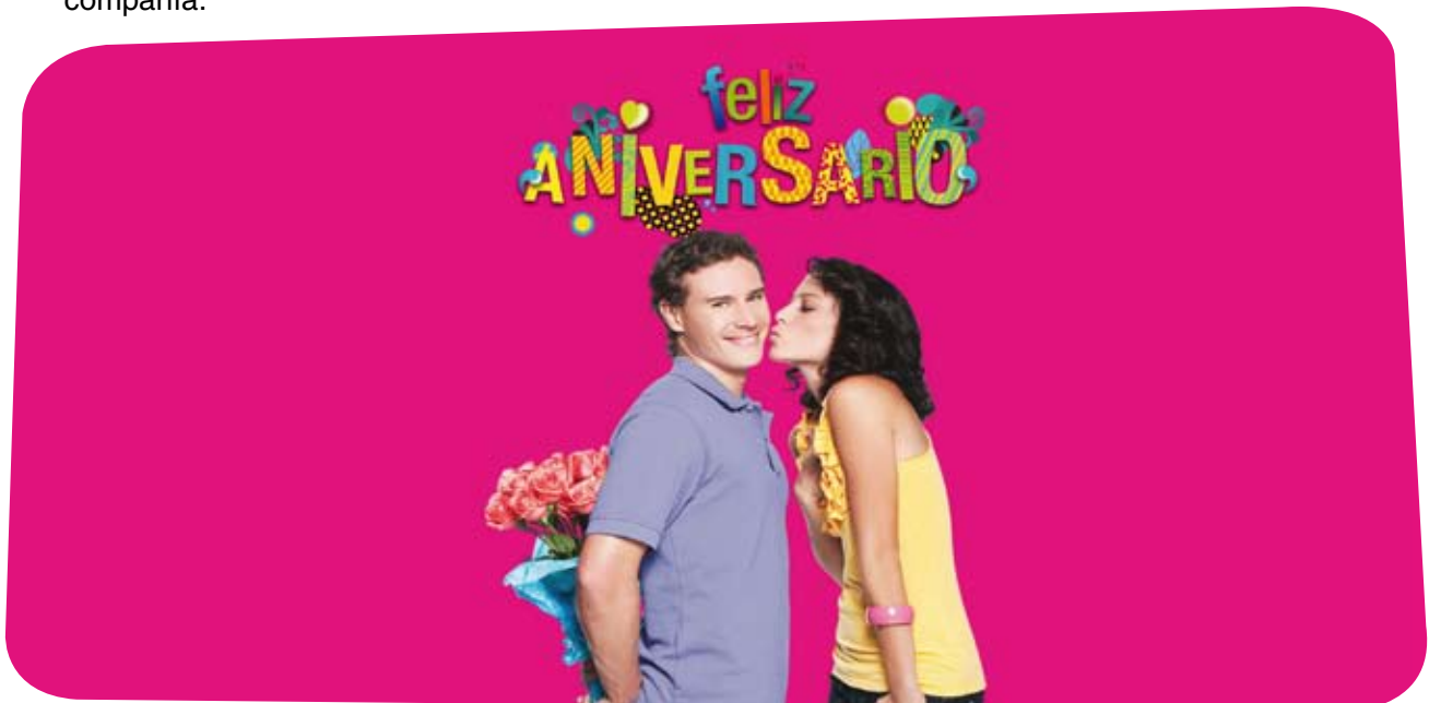
La promoción de aniversario Exito se realizó en 40 ciudades de Colombia

Gastos de administración y ventas. Permanecieron estables incrementándose levemente 0.1% a $359,665 millones comparado con $359,467 millones para el mismo período del año anterior. Como porcentaje de los ingresos operacionales, los gastos de administración y ventas decrecieron a 20.9% de 21.6% registrado en el primer trimestre de 2009. Esto se debió principalmente a (i) la aplicación continua de las iniciativas de control de gastos y (ii) las ventas de este trimestre fueron mayores lo que contribuyó a que los gastos se diluyeran.