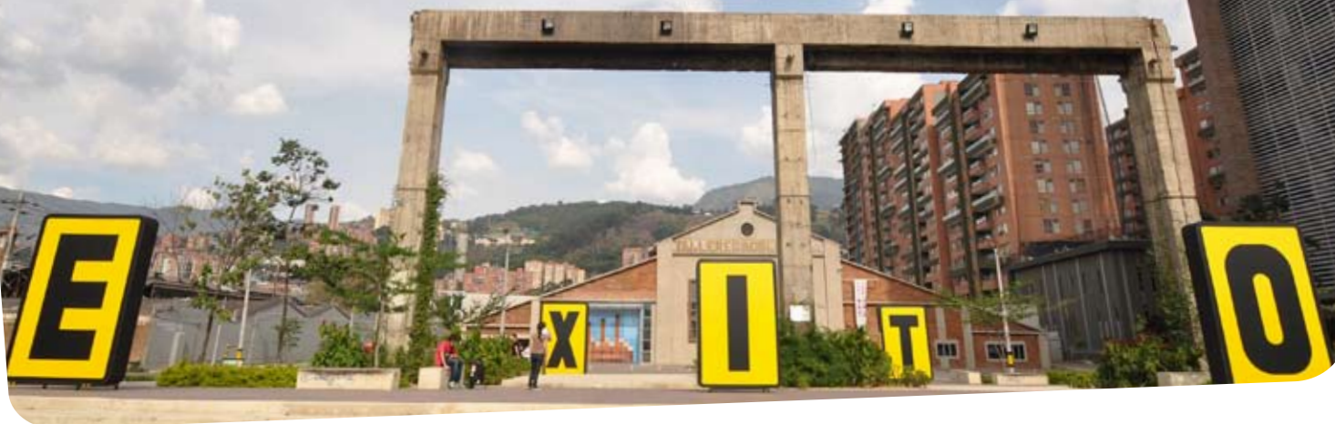
Las cinco letras que conforman el logo del Exito se tomaron la ciudad de Medellín, en una actividad especial de mercadeo.