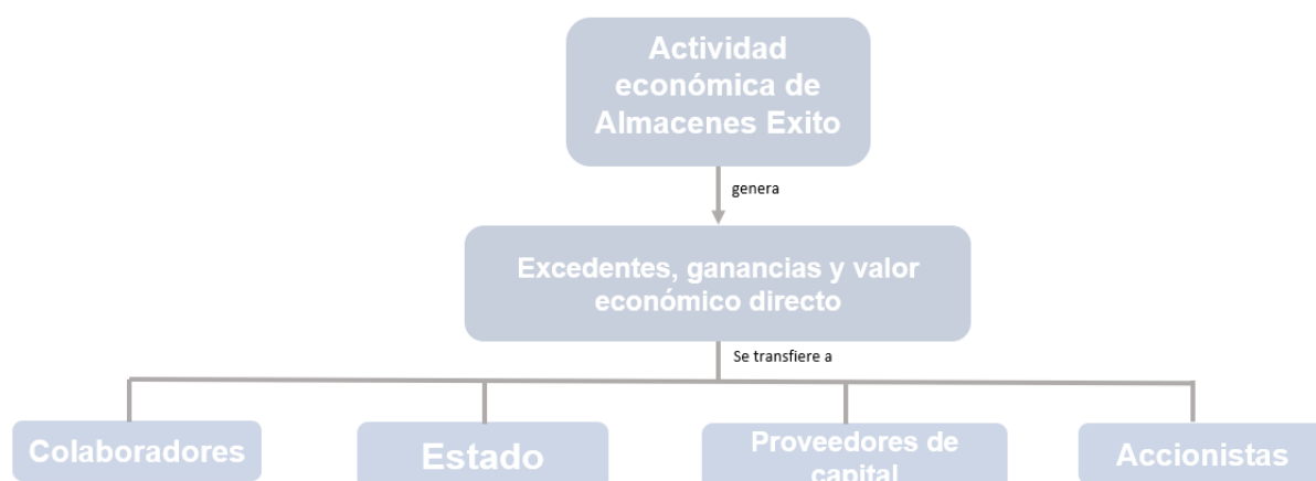
Figura 2: Generación de valor económico directo

Este valor entregado a colaboradores, al Estado y a los proveedores de capital, es puesto en circulación en la economía a través de formas de consumo, de gasto público o a través de la generación de proyectos de inversión públicos o privados, que contribuyen a su vez a generar valor en otras instancias de la economía. Adicionalmente, en su operación cotidiana, compra productos y servicios a sus proveedores, propiciando que ellos generen valor mediante un efecto multiplicador en los encadenamientos productivos, al que sin embargo se deben sustraer las externalidades negativas que también se generan. La suma de todo ello conforma el valor económico indirecto .