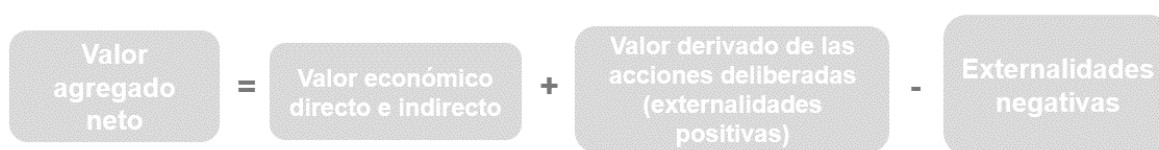
Figura 1: Generación de valor agregado neto

Por una parte, está su operación natural como empresa de Retail , y las actividades que realiza para llevar a cabo este objeto social, es decir, la forma en que el Éxito impacta la economía por desarrollar su objeto social, y por existir, operar y cumplir con las normativas obligatorias impuestas por la legislación. En ese ejercicio de su labor, se genera no sólo valor para accionistas y otros grupos de interés, sino también efectos multiplicadores de la gestión y externalidades negativas, asociadas al giro ordinario de los negocios. Por otra parte, la empresa realiza voluntariamente y de manera discrecional actividades adicionales a la operación del negocio, las cuales denominamos “acciones deliberadas”, que constituyen los programas de inversión social, económica y ambiental que nacen de forma voluntaria desde la iniciativa humanista del Éxito. Esto se resume en la figura 1.